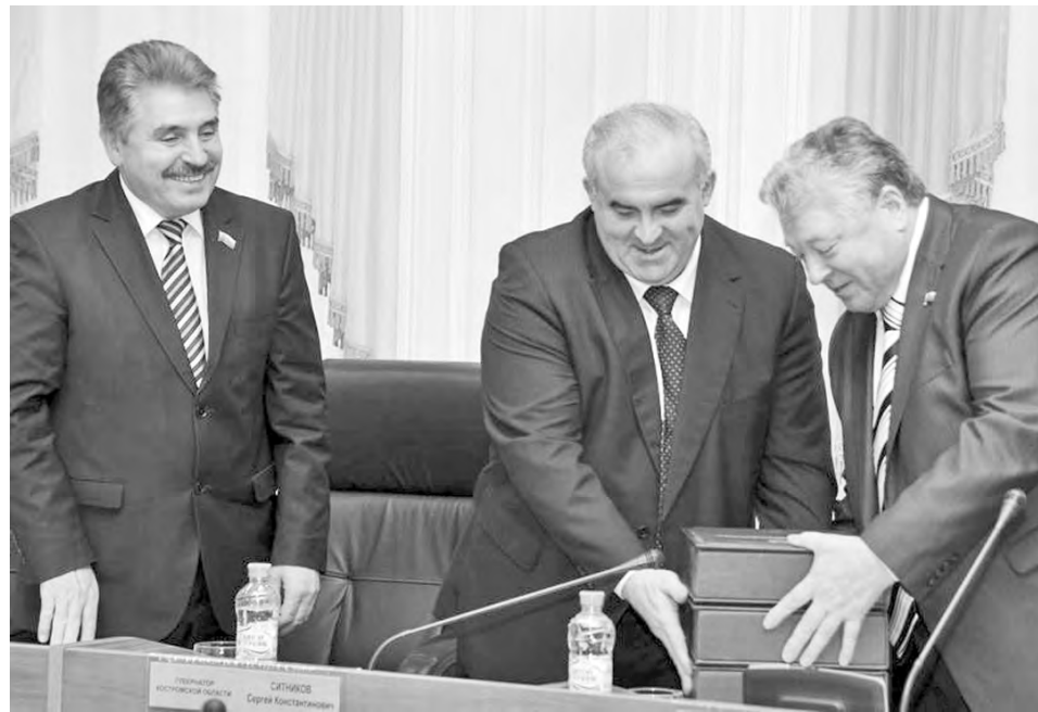
Глава региона передал Думе три объемных тома

Основные параметры проекта областного бюджета: доходы в 2014 году - 19,7 млрд. рублей, в 2015 году - 20,3 млрд., в 2016 году - 20,0 млрд. Расходы